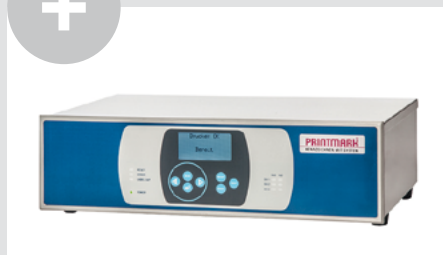
Systemsteuerung: PCU IV