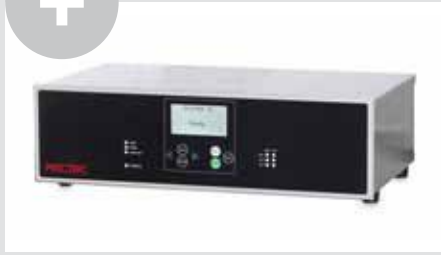
Systemsteuerung: PCU IV